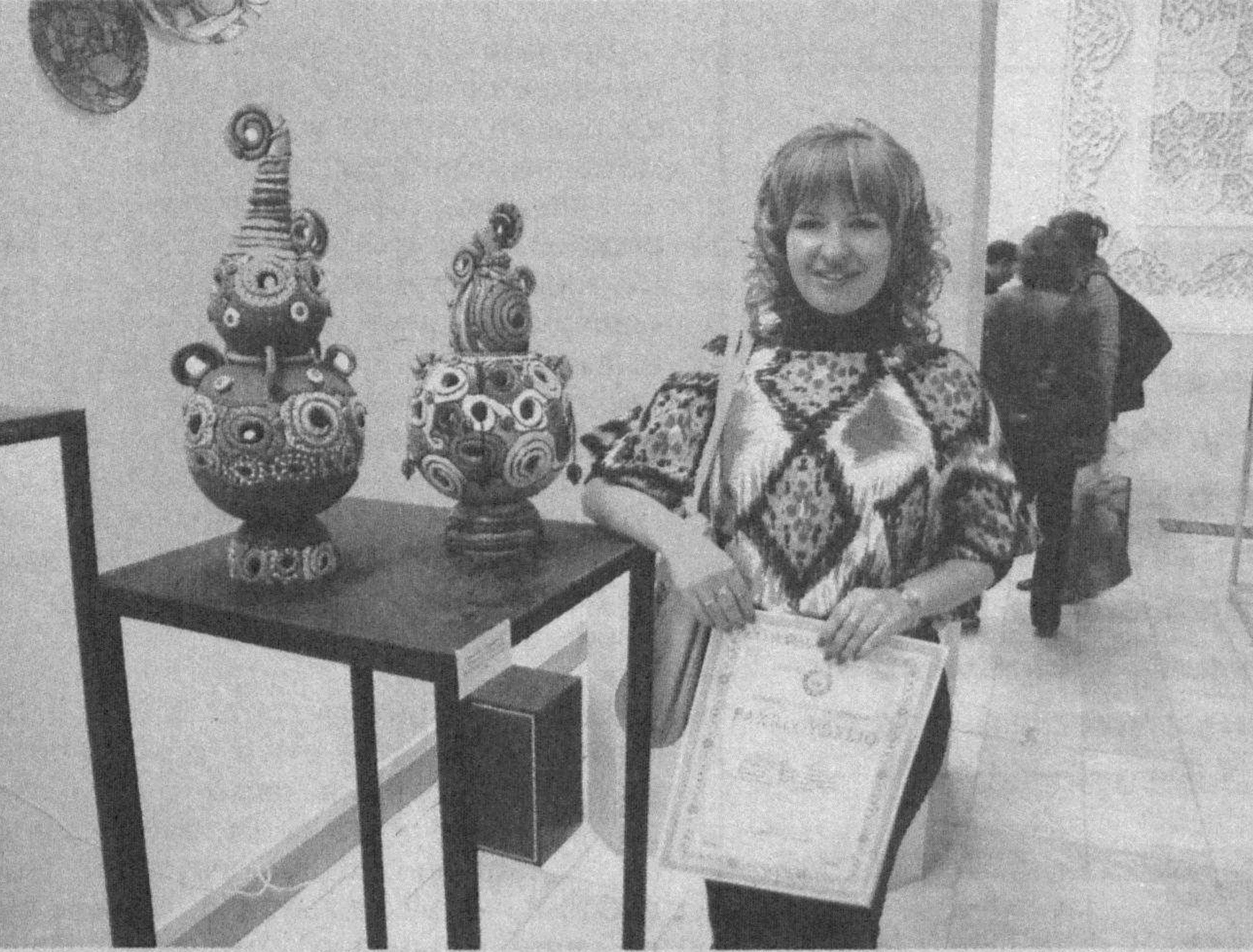
Выставка продолжит работу до конца ноября.