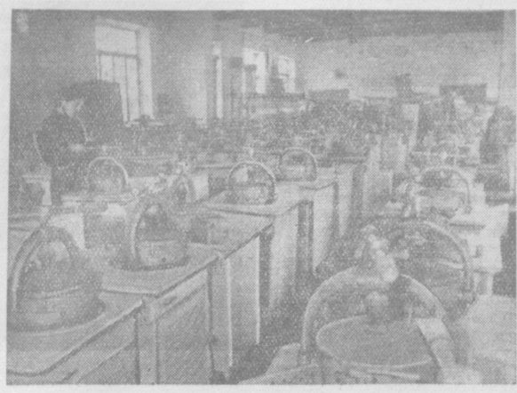
На ташкентском заводе «Узбекхлопкомаш» начались серийный выпуск приборов для определения влажности и засоренности хлопка-сырца. На снимке: новые аламеры, готовые к отправке.

Вспомните, какой даже завел себе «колониальную английскую шляпу», «как положено». Занимались и местные купцы — богатей Курбанбай, Саид-Албар, Тезебай.