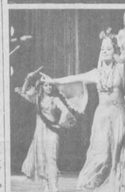
Зрелая молодость «Бахора»

Компания Роллс — Ройс прожила долгую жизнь (1863—1933). Был душой фирмы, завод знал как свои пять пальцев.