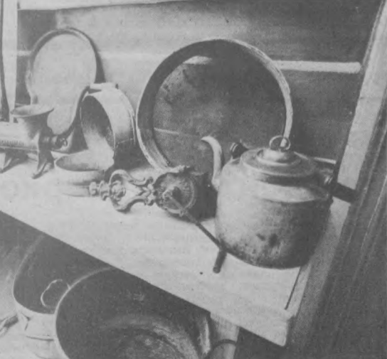
Именно такая посуда была в обиходе самого популярного «Большого Патристического трактора И. Я. Тестова», в знаменитом «Яру», «Славянском базаре». НА СНИМКЕ: кухонная утварь. Фото А. Косинца. Фотохроника ТАСС.

Ю. КРАВЧЕНКО, член общества «Мехрибонлиг».