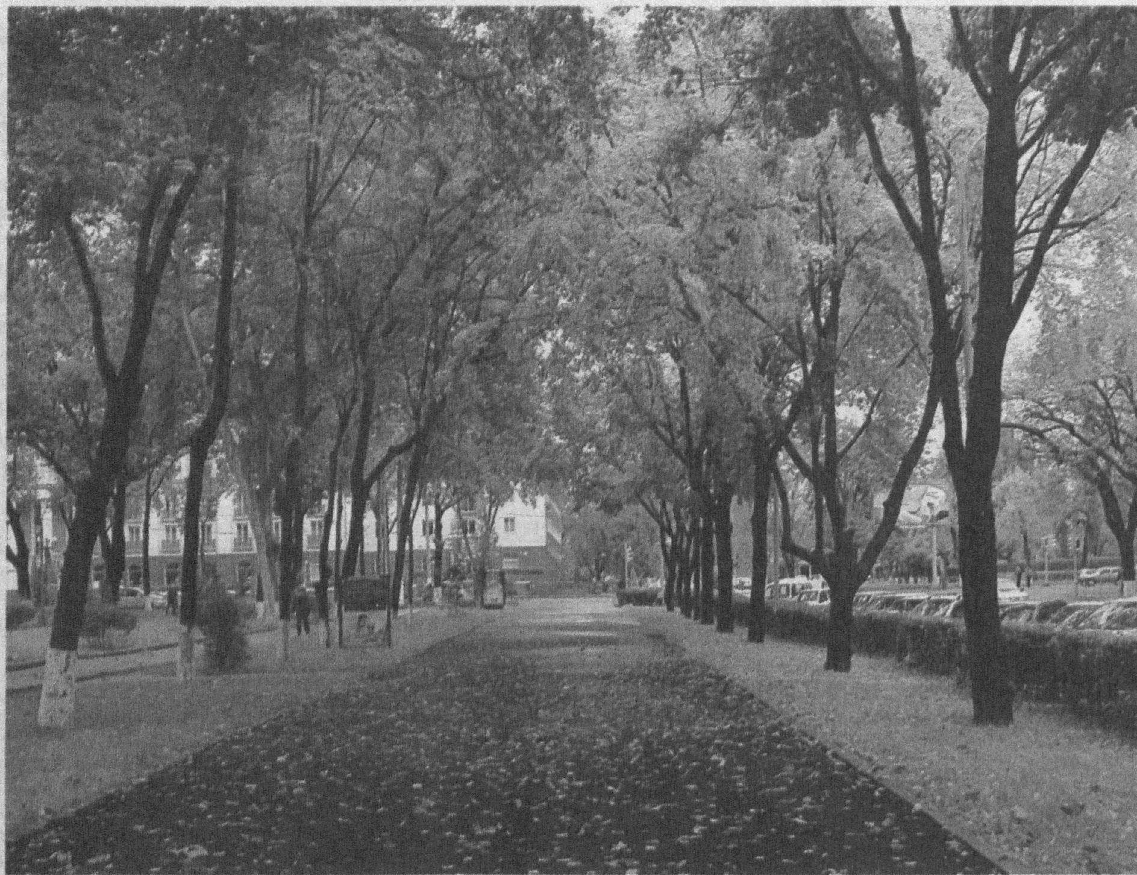
Город в преддверии зимы.