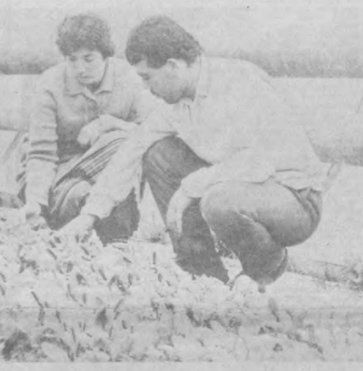
Развитие хозяйства в зимние сроки заасфальтировали дорожки... Заметно улучшились и условия труда на ферме...