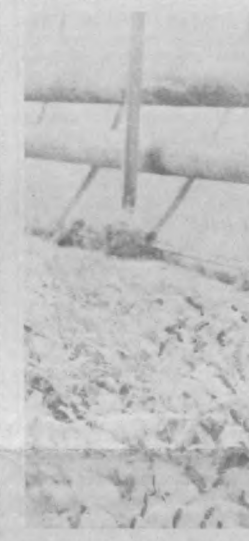
Развитие хозяйства в зимние сроки заасфальтировали дорожки... Заметно улучшились и условия труда на ферме...