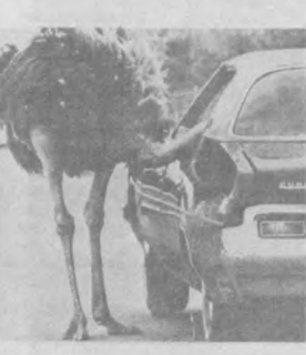
В. ЗАПОРЖЕНКО.

...а вещь очень даже полезная. Главное: как влезть, как поместиться? Об этом — с юмором американка М. Мейерс, англичанка А. Сидли и И. Кукси. Они стали известными благодаря международному конкурсу «Юридический пресс-фото».