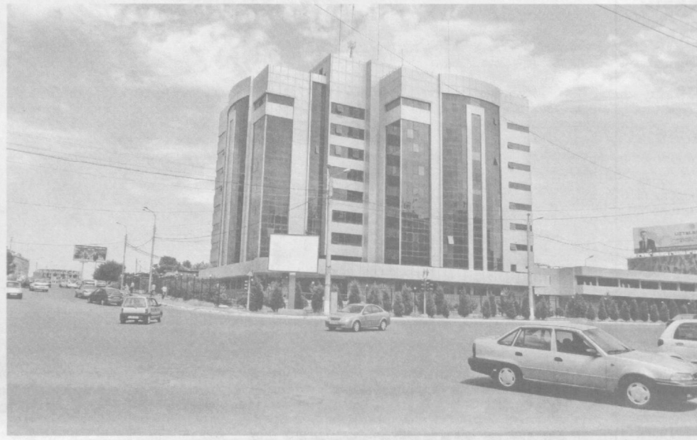
Современный облик Ташкенту придают широкие, удобные автомагистрали.