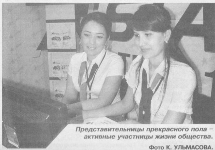
Представительницы прекрасного пола – активные участницы жизни общества.

репление материально-технической базы учебных заведений, внедрение новых педагогических технологий, совершенствование системы подготовки и переподготовки кадров – все это и многое другое позволило поднять сферу образования на новый, более качественный уровень. Компьютерные классы, лабораторные кабинеты, оснащенные всем необходимым, электронные информационно-ресурсные центры – сейчас это реалии повседневной жизни, а ведь 20 лет назад об этом мы могли только мечтать.