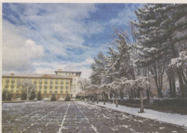
Зимний Ташкент полон очарования.