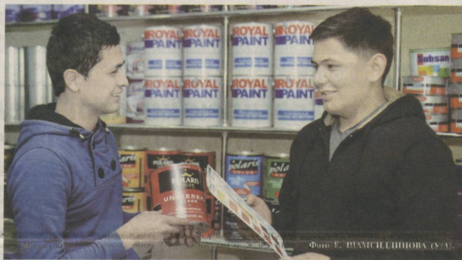
Отечественные предприниматели предлагают потребителям широкий выбор различных товаров.