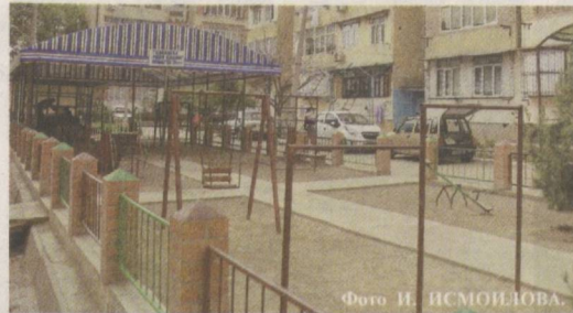
Благоустройство придомовых территорий — важная задача.

Всегда интересен опыт конкретных организаций, предприятий, служб по выполнению собственных функций, ведь он может послужить и другим в качестве наглядного примера.