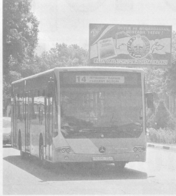
Столица и его жители в ожидании юбилея.