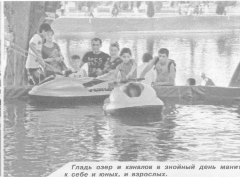
Гладь озер и каналов в знойный день манит к себе и юных, и взрослых.