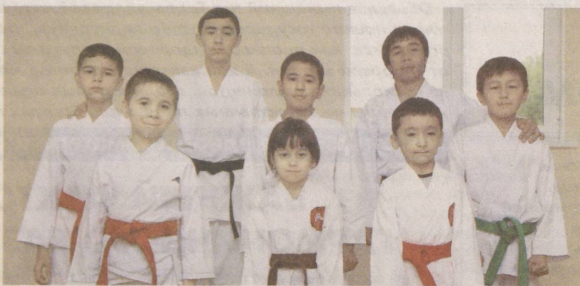
Усиленные тренировки – верный путь к победе.