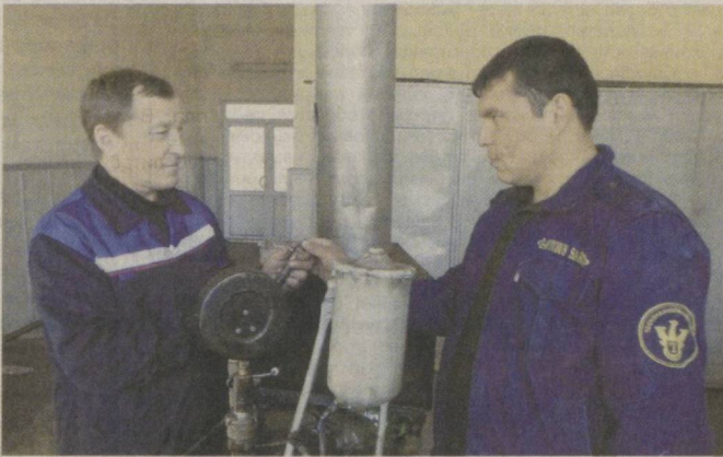
А. ГУЛЯМОВ.

Лучше, чем годом ранее, эксплуатировался подвижной состав – вовремя проводились технические осмотры и обслуживание автобусов, об этом свидетельствует увеличение коэффициента использования парка – 0,8 против 0,7 в 2014 году.