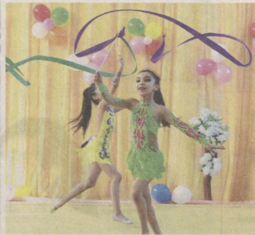
Спорт — фактор здорового образа жизни.