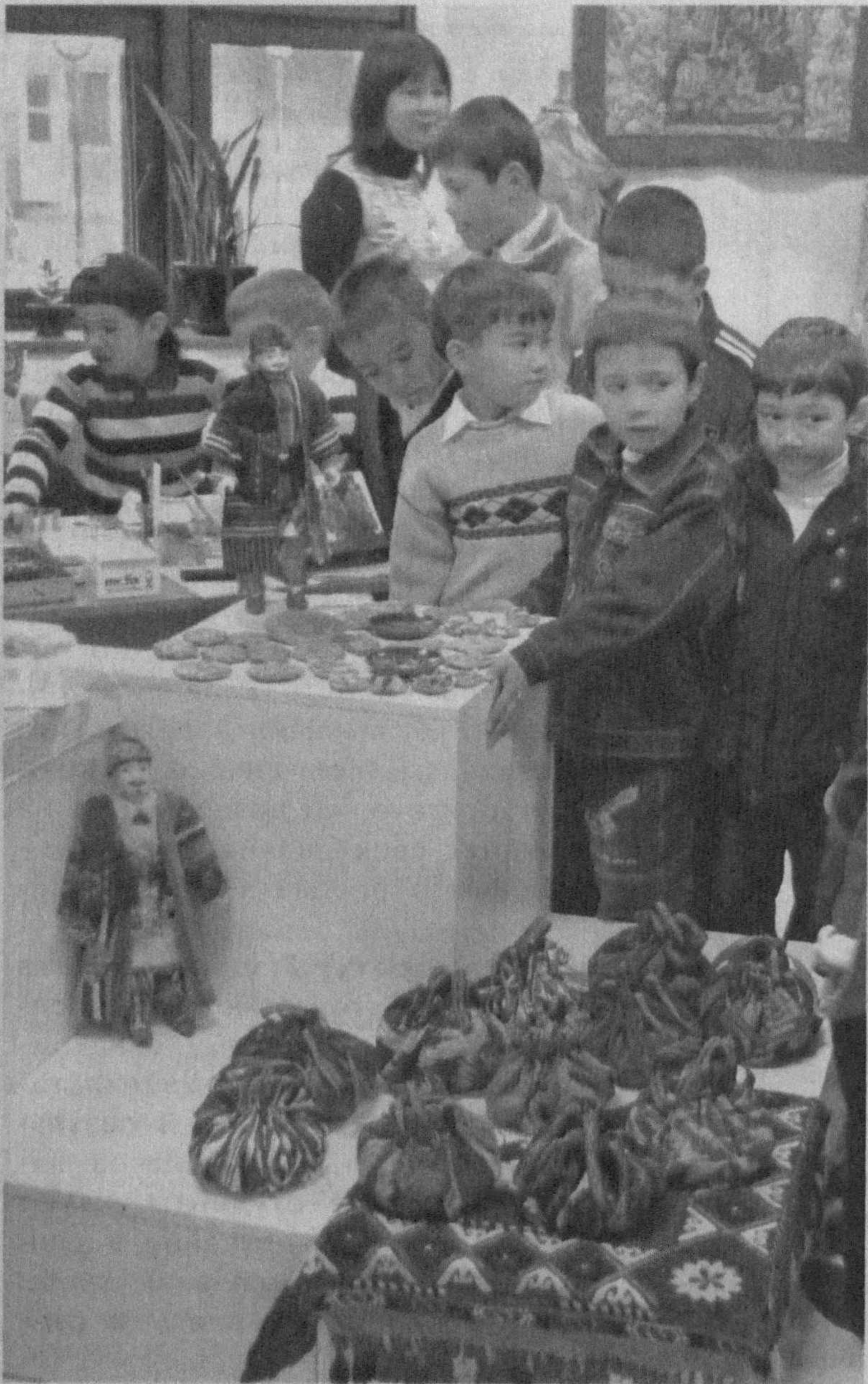
На экскурсии.