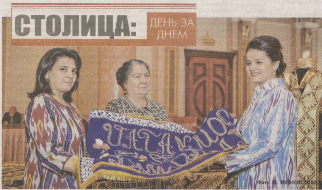
Растет вклад в экономический потенциал страны предпринимателей и ремесленников столицы.