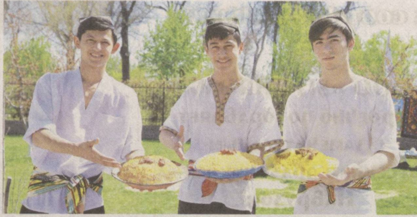
Очарование нового дня.