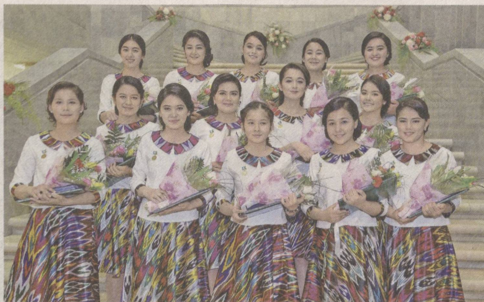
В нашей стране немало талантливых девушек.