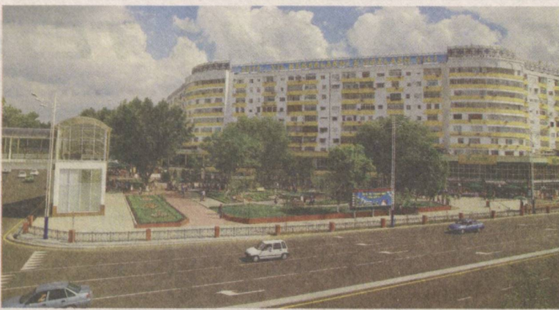
Весной улицы столицы становятся краше.