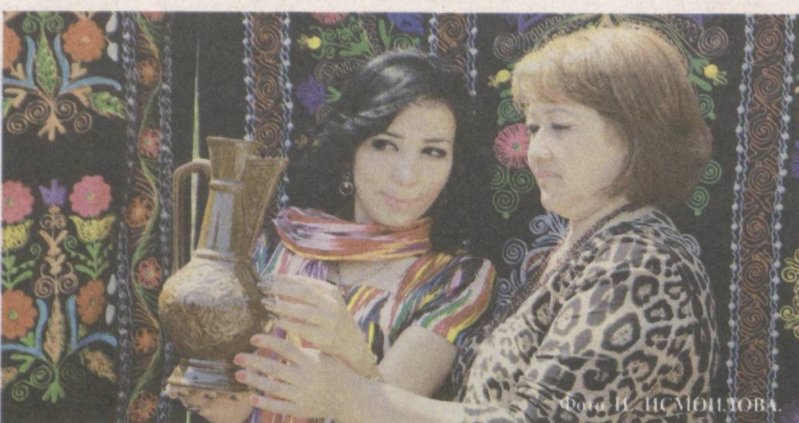
Национальное ремесленничество — сфера приложения талантов молодежи.