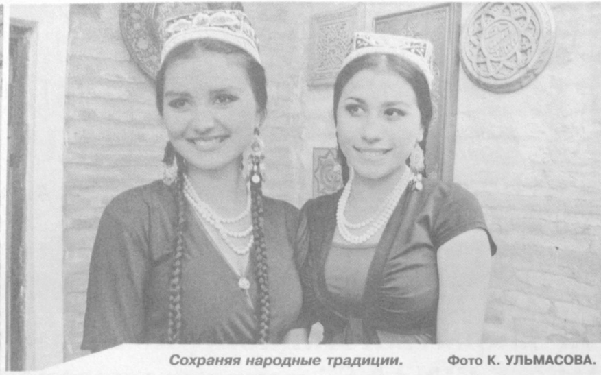
Сохраняя народные традиции.

Доброй традицией стало в канун очередной годовщины Дня независимости нашей страны проводить на предприятиях, в организациях, учреждениях и махаллах предпраздничные мероприятия, встречи и беседы, духовно-просветительские вечера, подводить на них итоги проделанной работы, делиться друг с другом достижениями, строить планы на будущее.