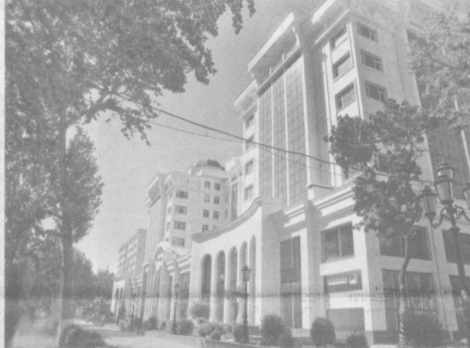
На площади и улицы города пришел праздник.

После обретения нашей страной независимости перед молодым поколением открылись безграничные возможности для самосовершенствования и реализации самых смелых замыслов. Постоянно чувствуя поддержку и заботу со стороны государства, наша молодежь растет гармонично развитой и всесторонне образованной. Раскрытию ее талантов способствует проведение различных конкурсов, олимпиад, соревнований и поощрение участия в них, нашедшие отражение в судьбе выпускницы академического