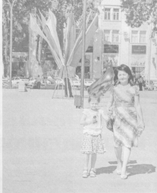
Праздничная столица.

В годы независимости не только бережно сохраняются прежние народные традиции, но и рождаются новые. Одна из них – радостно, открыто, что называется, всем миром отмечать праздники. И конечно, самые масштабные торжества проходят в День независимости республики.