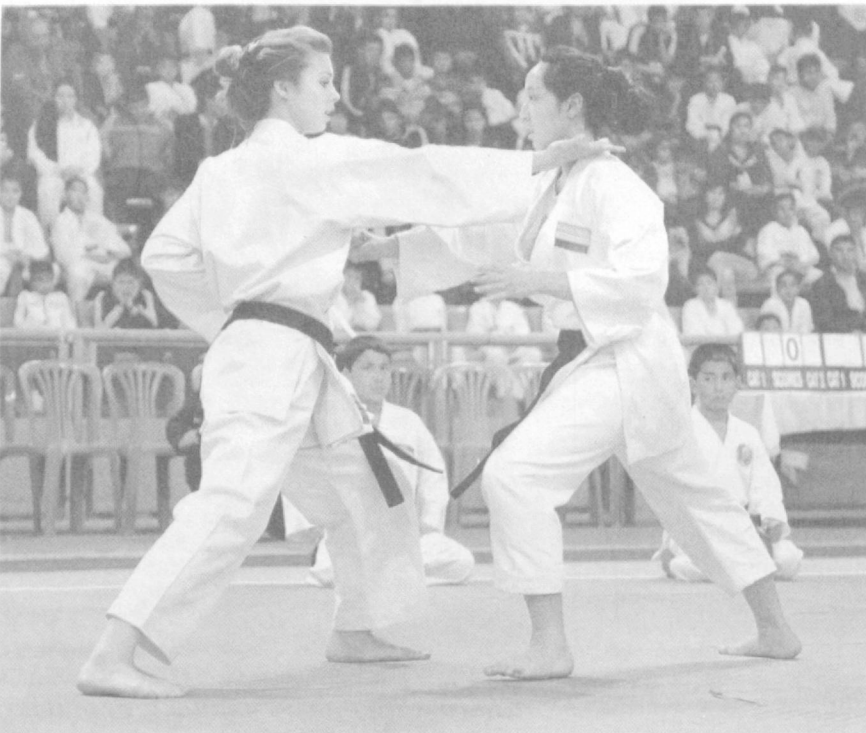
Спор на татами выявит сильнейших.

В Еврейском культурном центре состоялся музыкально-литературный вечер, посвященный творчеству заслуженного артиста Республики Узбекистан, члена Союза писателей Узбекистана Владимира Баграмова. Прозвучали его стихи и фрагменты прозаических произведений, авторские песни.