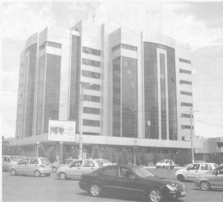
Благоустроенные улицы и проспекты столицы.