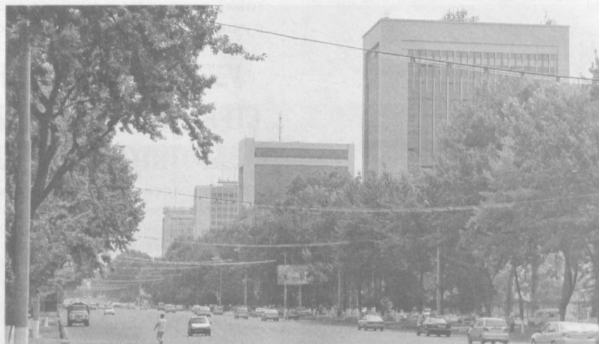
Во имя интересов человека благоустраиваются и хорошеют улицы столицы.

Пресс-служба Законодательной палаты Олий Мажлиса Республики Узбекистан.