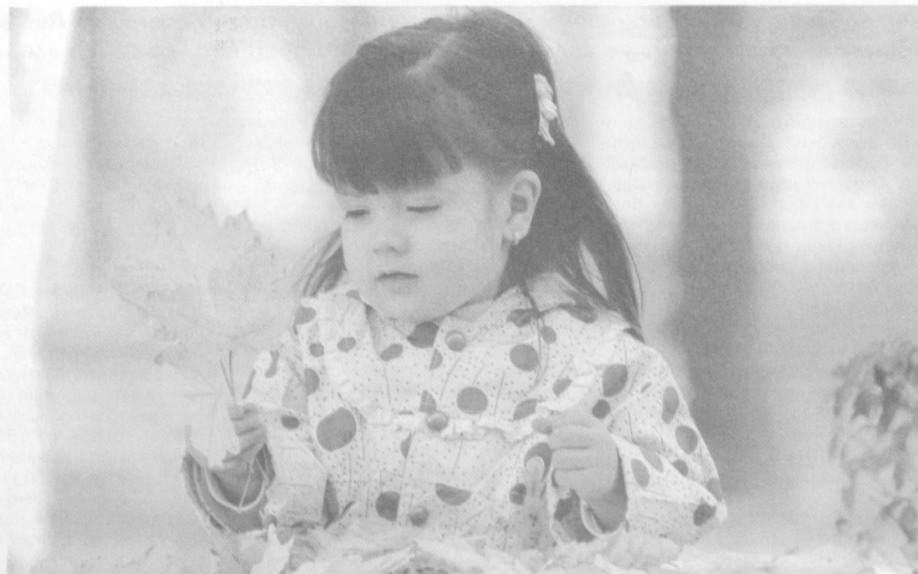
Соберу букет из листьев.