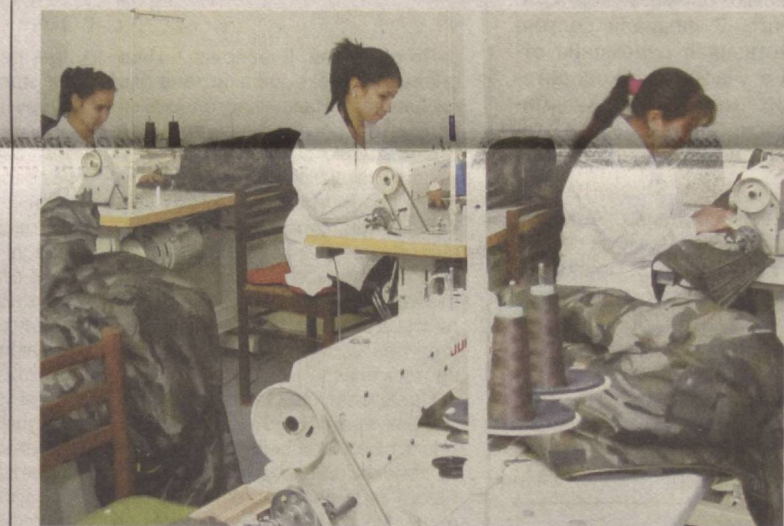
Благодаря целенаправленной государственной поддержке субъектов малого бизнеса неуклонно растут производственные мощности, создаются дополнительные рабочие места.

В 2013 году было проведено более 385 тысяч мероприятий по правовой пропаганде. Важный вклад в эту работу вносит созданный при Министерстве юстиции Межведомственный совет по координации работы государственных органов по правовой пропаганде и просвещению.