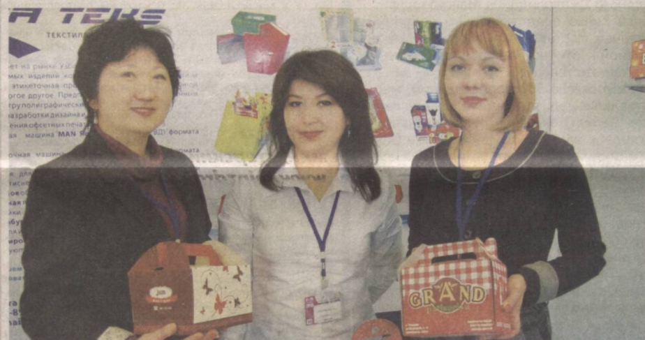
Покупатели довольны, если выбор товаров широк.

Одним из приоритетных направлений развития отечественной фармацевтической промышленности является организация производства современных лекарственных препаратов, изготавливаемых из лекарствен-