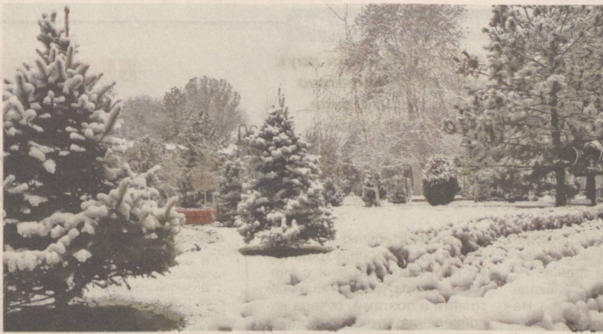
Городские красавицы-ели в снегу.

Национальной паралимпийской ассоциацией Узбекистана на местах организуются различные мероприятия, учебные семинары и соревнования с целью поддержки молодежи с ограниченными физическими возможностями, дальнейшего развития паралимпийского движения, выявления талантливых спортсменов и включения их в сборные команды.