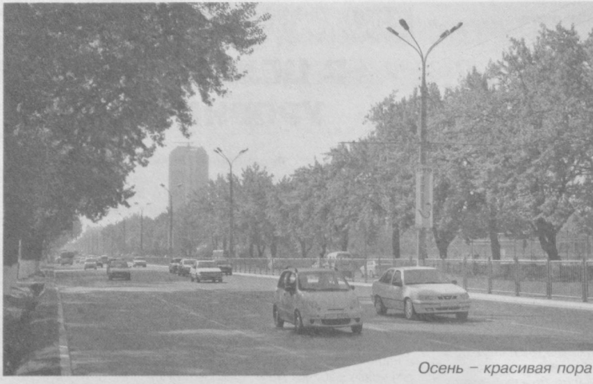
Осень – красивая пора