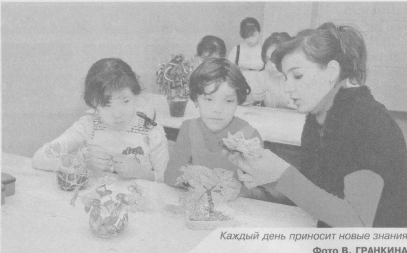
Каждый день приносит новые знания.