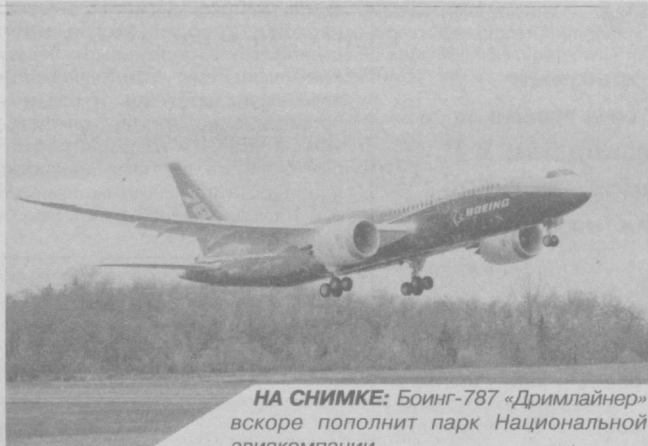
НА СНИМКЕ: Боинг-787 «Дримлайнер» вскоре пополнит парк Национальной авиакомпании.

Современная техника и профессионализм специалистов – главные составляющие, обеспечивающие ежегодную положительную динамику роста объемов перевозок и доходов Национальной авиакомпании «Узбекистон хаво йуллари».