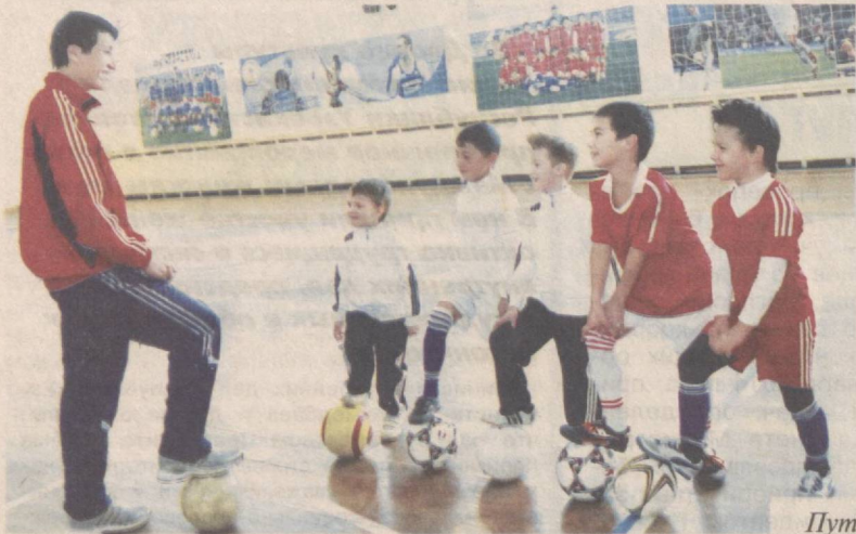
Путь к большим победам начинается в детстве.