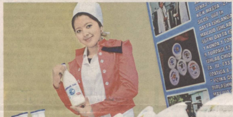
Широкий ассортимент продовольственных товаров предлагают столичные предприниматели.

Следующее важное направление в деятельности Ташкентского городского территориального объединения ОЗПП – пропаганда законодательства о защите прав потребителей. С этой целью проводятся конференции, семинары, «круглые столы», конкурсы, бесе-