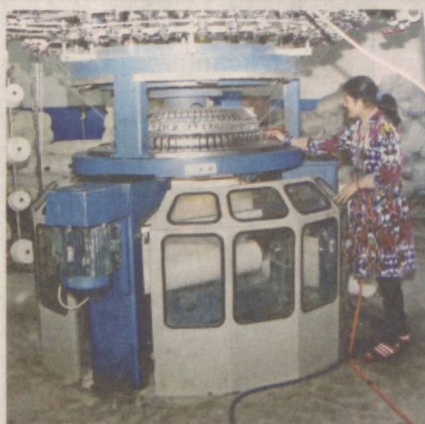
В русле реформ

Члены фракции Социал-демократической партии «Адолат» особо отметили, что обеспечению верховенства Конституции и закона будет способствовать внесенная в Конституцию поправка, устанавливающая, что Президент может приостанавливать или отменять акты органов государственного управления страны и хокимов только в случае несоответствия их нормам законодательства. Тем самым одновременно