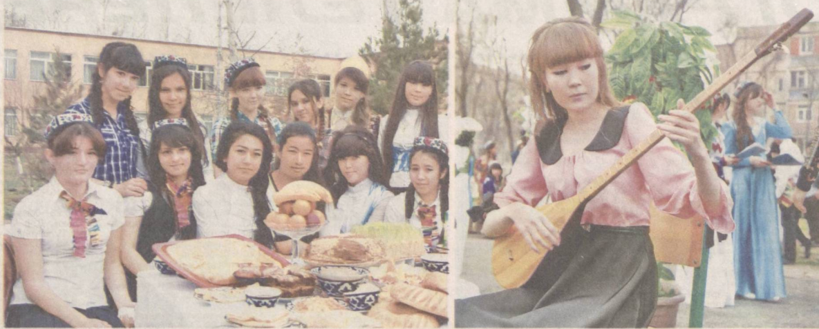
Весело и радостно встречаем Навруз!