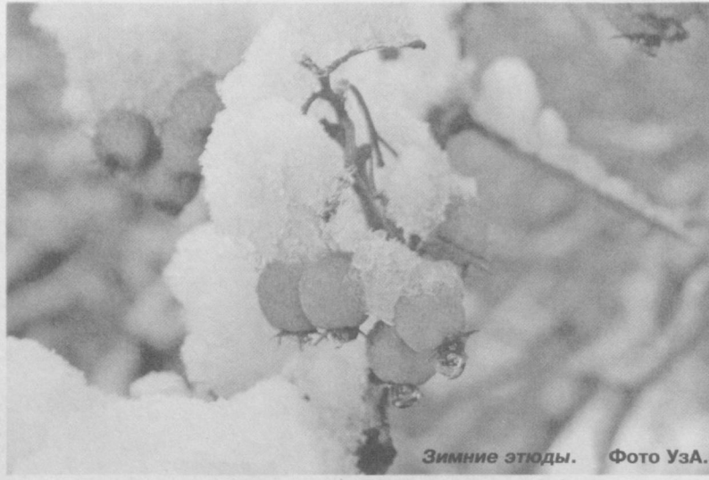
Зимние этюды.

23 января в ташкентской галерее «Art and Fact» состоится открытие выставки OBSCURA 2.1. Она станет продолжением проекта «Пинхол-фотография», стартовавшего в 2010 году в городе Ташкенте, сообщает НИА «Туркистон-пресс».