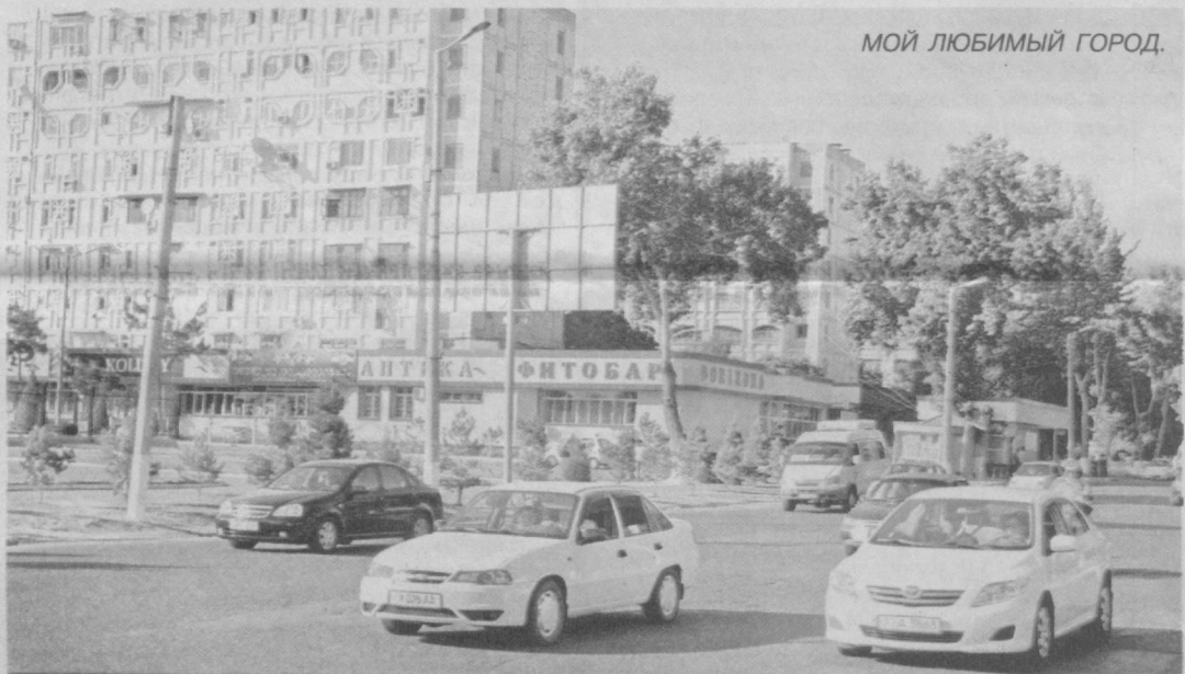
МОЙ ЛЮБИМЫЙ ГОРОД.

С первых лет независимости в нашей стране проблемы занятости, эффективного использования трудовых ресурсов и другие социальные вопросы занимали и продолжают занимать особое место. Именно человеческие ресурсы позволяют обеспечивать экономический рост и благосостояние народа.