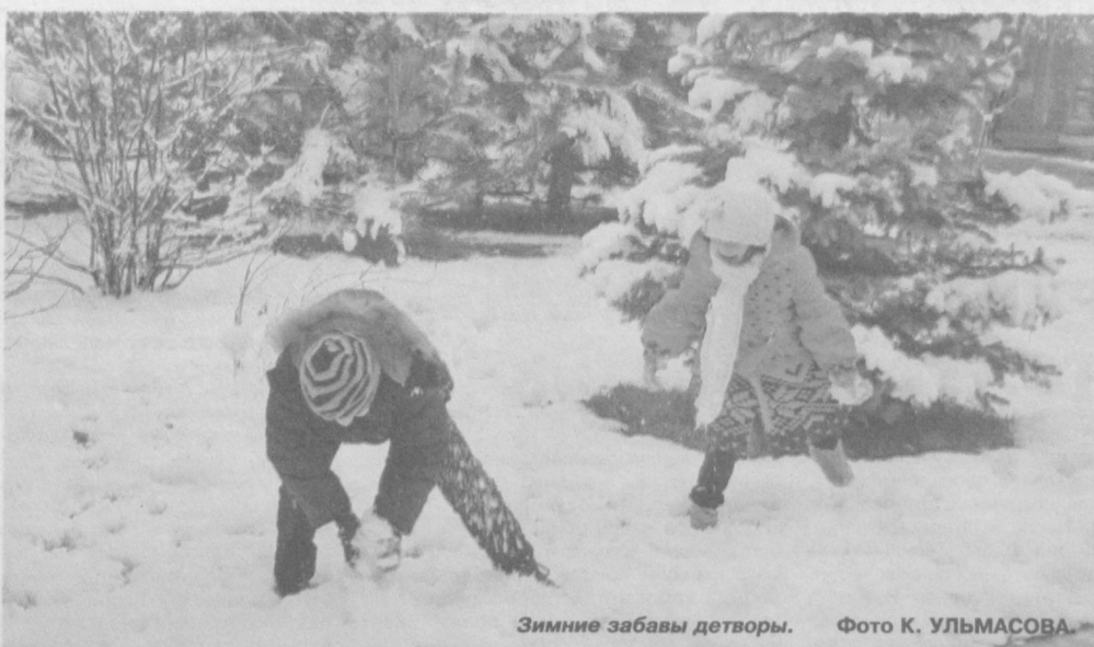
Зимние забавы детворы.