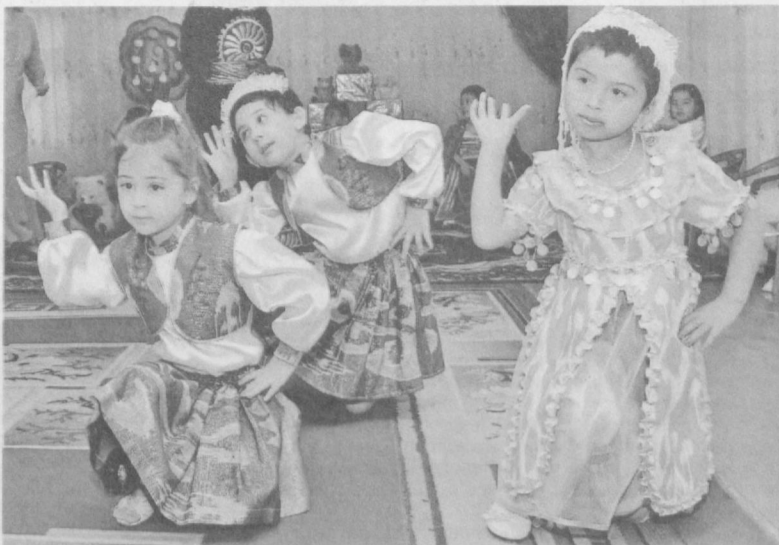
Приобщение к искусству начинается в детстве.