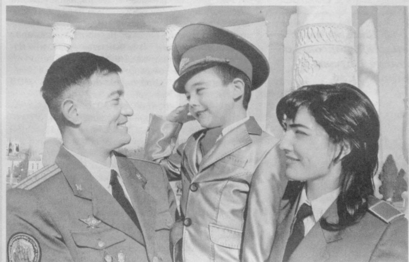
Растим достойную смену.

Часто молодые мамы советуются с более опытными, выбирая стратегию воспитания своего ребенка. И с удивлением обнаруживают, что их советы не просто разнятся – нередко они диаметрально противоположны.