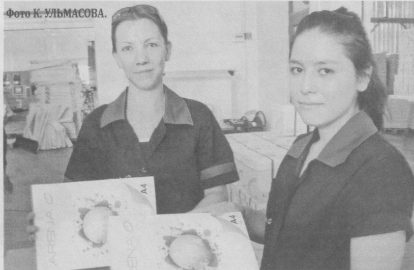
Большой ассортимент бумажной продукции с учетом потребностей рынка выпускает СП ООО «Arena Holding Group».