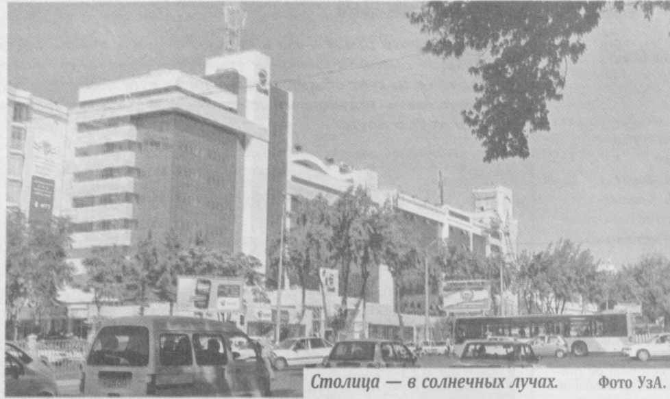
Столица — в солнечных лучах.