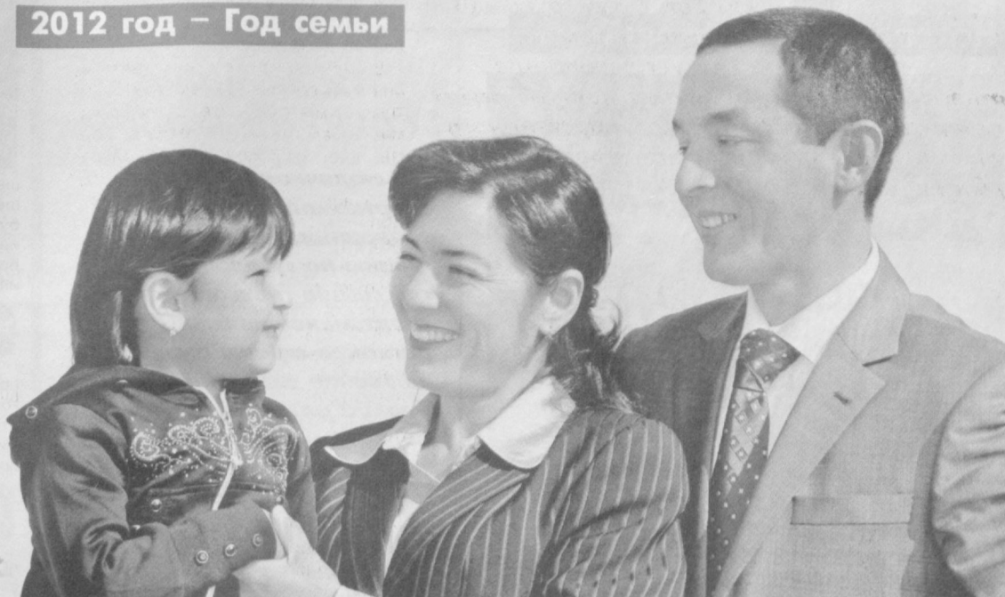
Счастливая семья – основа благополучия общества.

Под руководством Президента Ислама Каримова созданы необходимые условия для эффективной деятельности махаллей, что играет важную роль в сохранении мира, спокойствия и стабильности в нашей стране, особенно защите прав женщин и детей. В Год семьи ширятся масштабы проводимой в данном направлении работы.