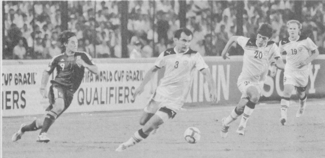
Каждый футбольный матч богат захватывающими моментами.