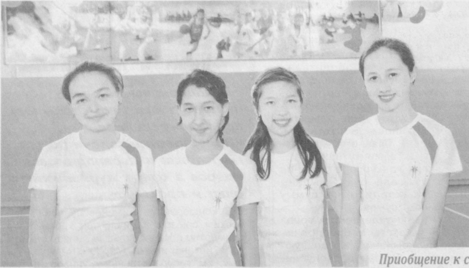
Приобщение к спорту начинается с детства.