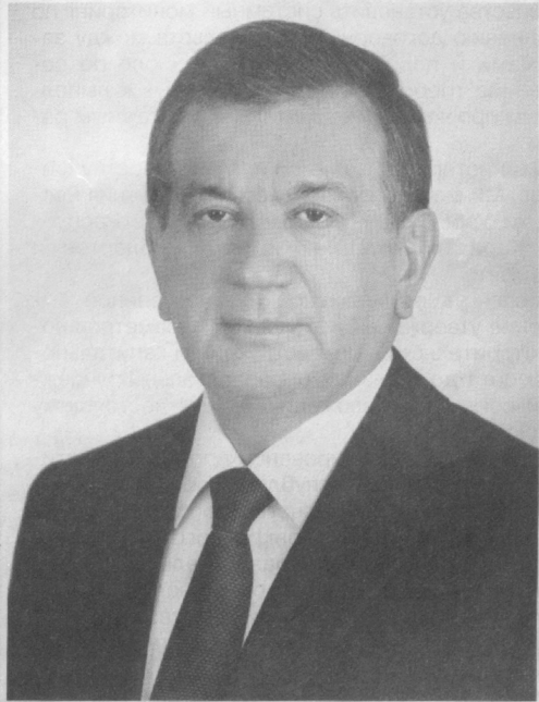
Одним словом, уходящий год был для нас во многом успешным и благополучным.

Особенно прославили страну наши спортсмены, добившиеся в этом году ярких, выдающихся побед на Олимпийских и Паралимпийских играх.