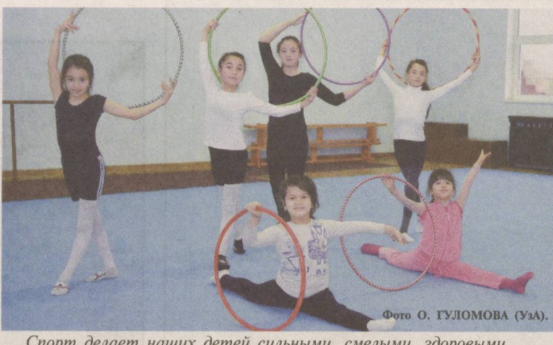
Спорт делает наших детей сильными, смелыми, здоровыми.