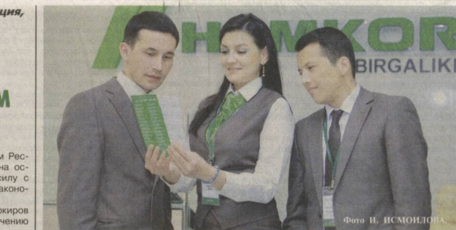
Банковская система – надежный помощник предпринимателей.

Уклонение от представления декларации о доходах, несвоевременное представление декларации или представление в ней заведомо искаженных данных в соответствии с Кодексом Республики Узбекистан об административной ответственности влечет наложение штрафа от одного до трех минимальных размеров заработной платы.