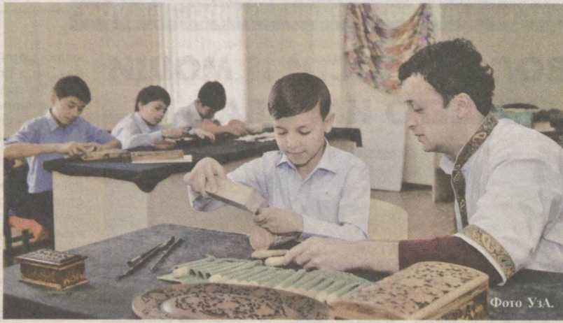
Национальные культурные ценности — достояние народа.