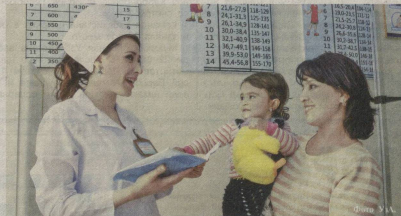
В семейных поликлиниках проводится важная работа по охране здоровья матери и ребенка.

Основой лечения диабета являются диета и лечебный режим. Диета должна быть составлена для каждого пациента индивидуально в зависимости от веса тела, возраста, физической активности и с учетом того, нужно ли ему похудеть или поправиться. Главной целью диеты для диабетиков является поддержание уровня сахара в крови в таких пределах, которые соответствуют уровню здорового человека, а также уровню жиров в крови и холестерина. Кроме того, важно, чтобы эта диета была разнообразной и содержала достаточное количество необходимых питательных веществ – белков, минеральных солей и витаминов. Одновременно она должна обеспечить такое количество энергии, чтобы вес тела пациента знер-