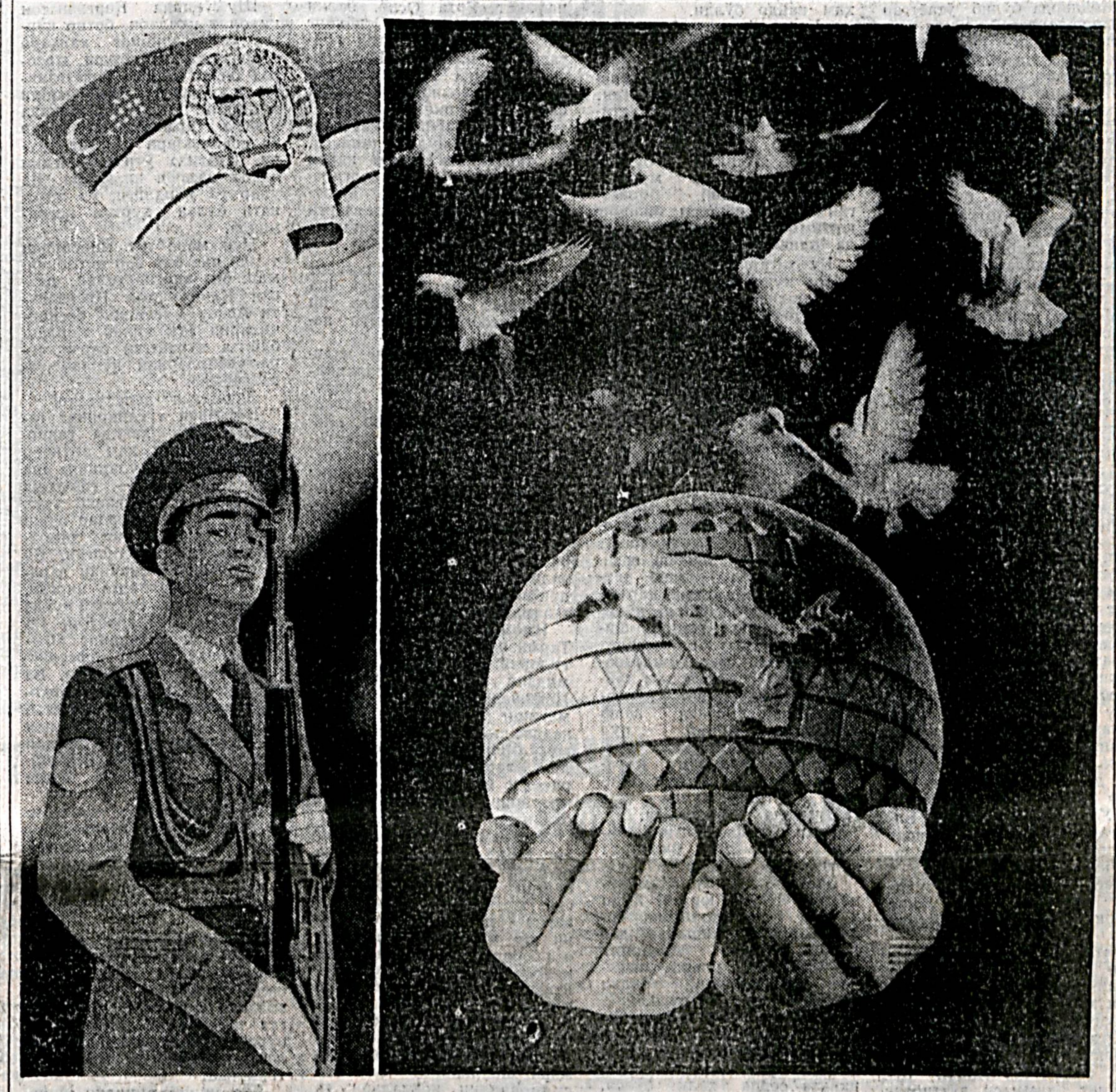
ЎЗБЕКИСТОН РЕСПУБЛИКАСИ МУДОФАА ВАЗИРИНИНГ БУЙРУғИ

Ассалому алайкум, азиз ватандашлар! Ҳақдаи мехмонлар! Халқимиз учун қувватли ва ҳаёқонли бўлган ушбу айёмда энг улуғ, энг азиз байрам — Мустақиллигининг тўққиз йиллик шодлиғи билан барча юртлиқларимизни, бутун халқимизни чин қалбимдан муборакбод этаман.