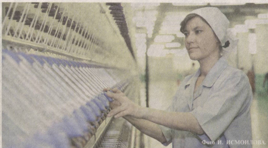
Образцовые условия труда – залог высокой производительности.