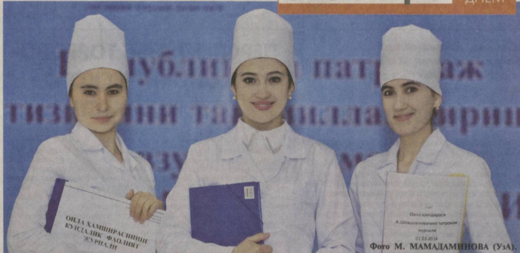
Работники первичного звена здравоохранения всегда готовы оказать качественную медицинскую помощь населению.