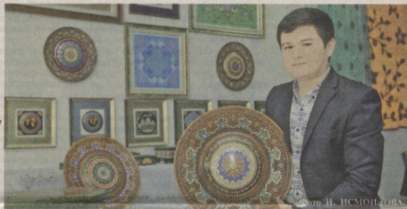
В годы независимости национальные ремесла получили второе рождение.

Не переводятся таланты в роду потомственных ремесленников, вот и новое, тре-