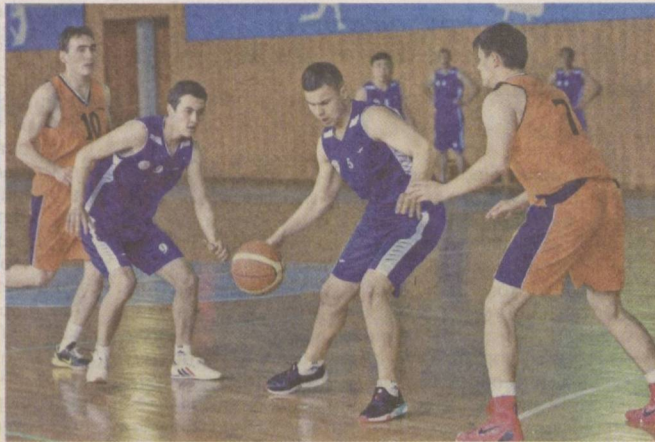
Спорт укрепляет здоровье и воспитывает силу воли.