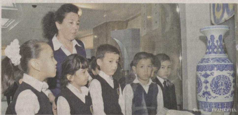
Экскурсии в музеи и выставочные залы способствуют духовному развитию подрастающего поколения.