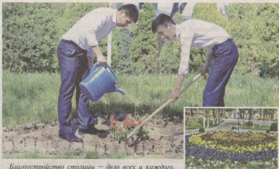
Благоустройство столицы – дело всех и каждого.

Самым же красочным и масштабным обещает быть праздник для учеников средних школ сто-