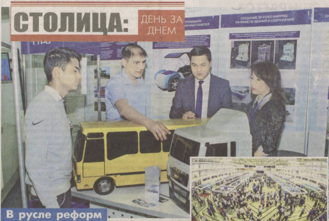
В русле реформ