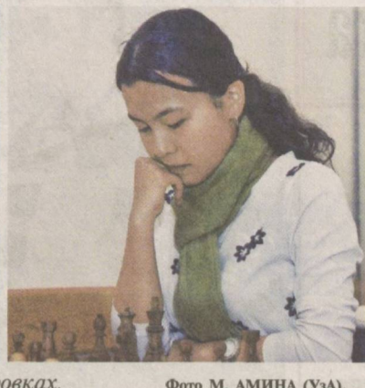
Спортивные рекорды рождаются в упорных тренировках.