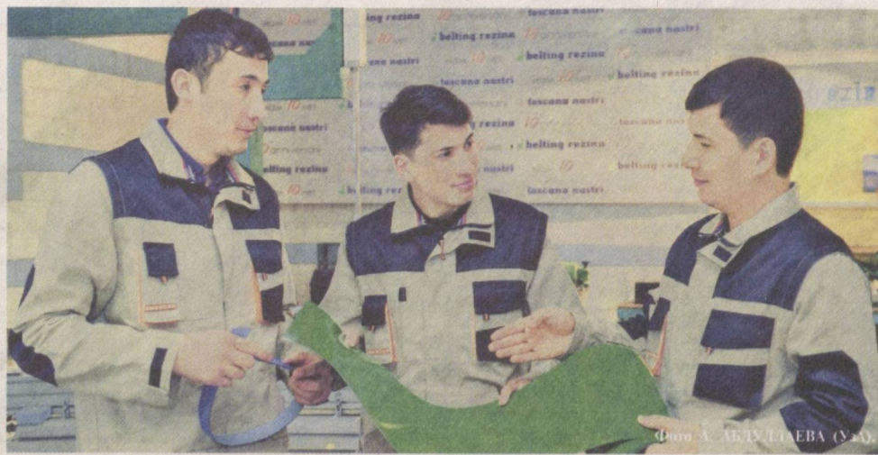
Охрана труда — важная составляющая работы профсоюзных организаций.

Согласно Указу Президента нашей страны «О мерах по дальнейшему усилению социальной поддержки ветеранов войны и трудового фронта 1941–1945 годов» от 13 ок-