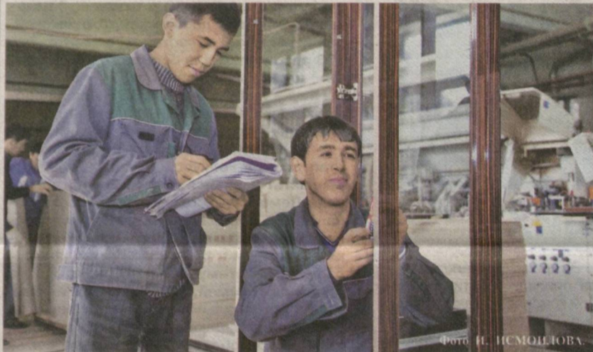
Современные технологии, внедряемые на предприятиях реального сектора экономики, позволяют выпускать качественную продукцию.