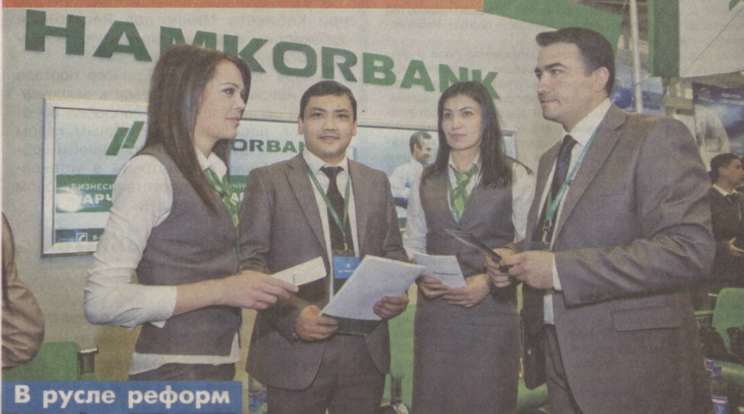
В русле реформ